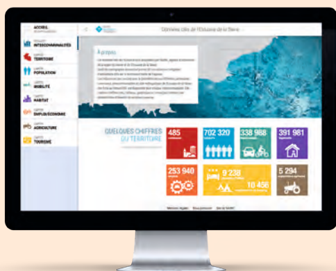
Plus de 20 cartes sur 6 thématiques sont consultables sur le portail

De nouvelles thématiques et de nouvelles cartes viendront étayer le portail dans les mois à venir.