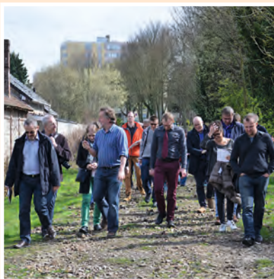
Une journée de visite du territoire pour en comprendre les différentes facettes