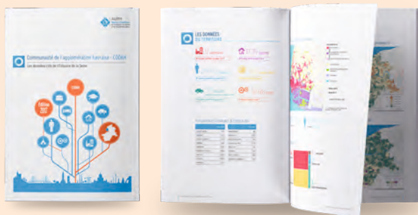
Une fiche Données clés est disponible pour chaque intercommunalité de l'Estuaire de la Seine