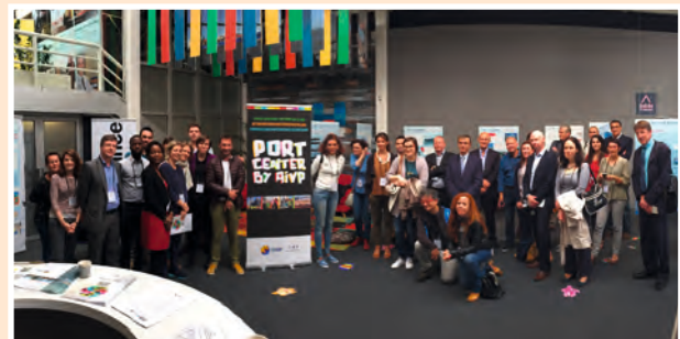
La quarantaine de participants de l'atelier Port Citoyen organisé par l'AIVP et le club maritime et portuaire de la FNAU