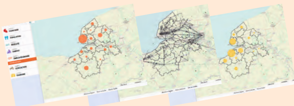
Quelques exemples de données et cartographies disponibles

+ 30 % des chambres d'hôtel qui se situent dans la CC de Cœur Côte Fleurie