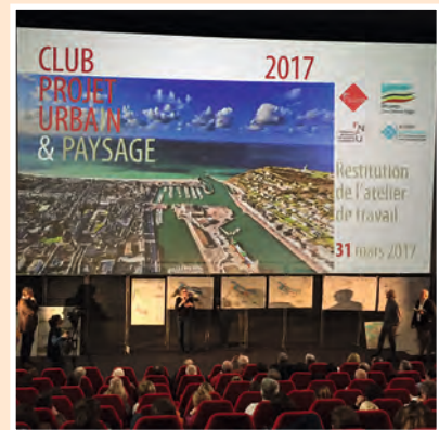
Une restitution des propositions du club devant près de 120 élus, professionnels et partenaires institutionnels