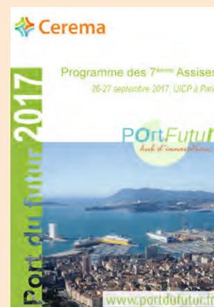
L'AURH était partenaire des 7 es assises du Port du Futur organisées par le Cerema