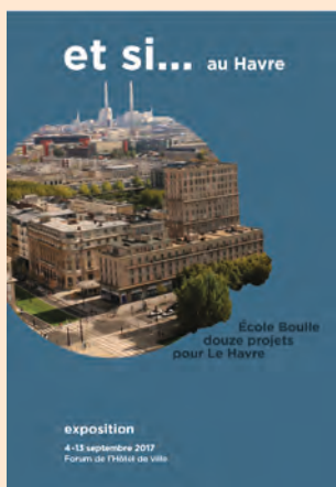
Exposition des douze jeunes designers de l'école Boule, accompagnés par l'AURH

Projet urbain et paysage / Planification / Eco-FNAU / Géomatique / Communication / Information-Documentation / Observation et ressources statistiques.