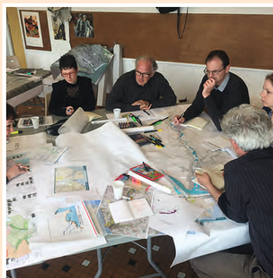
2 jours de travail intensif en groupe pour élaborer des pistes de réflexion