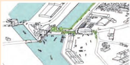
Les cinq projets lauréats pour les sites havrais