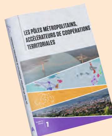
Les Pôles métropolitains, accélérateurs de coopérations territoriales, collection Points FNAU - Alternatives Gallimard