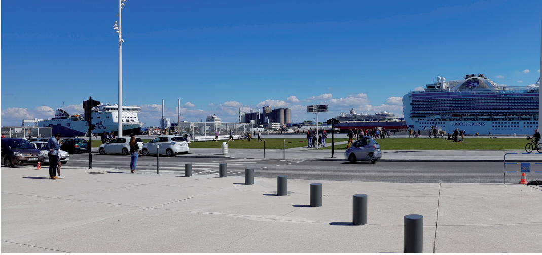
Au Havre, l'interface entre la ville et le port, un nouveau lieu d'art et de vie.

parcellaire hérités des développements portuaires et industriels. Si la ville est majoritairement construite autour d'une brique humaine et pédestre, ces territoires sont aménagés sur une base mécanique et motorisée. Cette dernière, fortement consommatrice d'espace, peut rapidement « piéger » les équipes de maîtrise d'œuvre en charge de leur réhabilitation, qui doivent sans cesse remettre en parallèle ces superficies avec celles de la ville héritée. Sans cette confrontation, le projet est voué à reproduire des échelles inadaptées à la vie urbaine, rendant l'émergence de cette dernière moins probable.