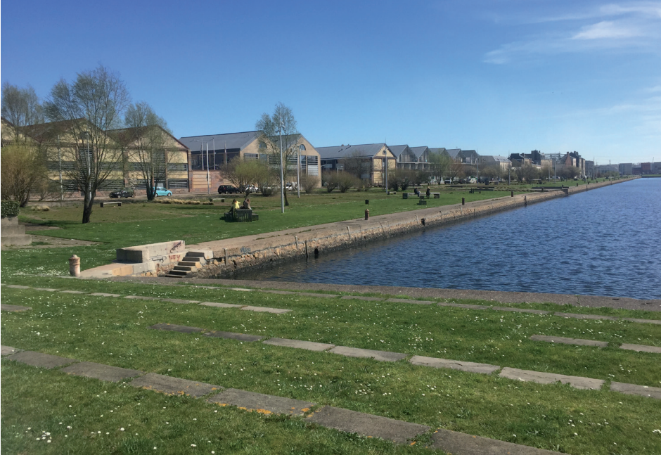
Les bassins portuaires réinventés pour en faire un élément d'attractivité.

lien entre la ville et son territoire géographique. Dès lors les bassins, les darses et les canaux prennent une importance considérable dans le récit urbain. Les espaces associés, qui constituent l'essentiel de l'interface ville-port, se retrouvent alors au premier plan du (re)déploiement urbain. Ces ambitions sont entretenues par de nombreux exemples réussis, notamment dans les métropoles nordiques comme Copenhague, Oslo ou Anvers. Ce rapport à l'eau et aux paysages associés devient alors un facteur d'attractivité et d'image pour les villes portuaires, un moyen de capitaliser sur une spécificité non délocalisable. Au Havre, c'est l'émergence du concept de « cœur métropolitain » qui cristallise ces enjeux. Secteur dynamique de projets, il est à la croisée du centre reconstruit (inscrit au patrimoine mondial de l'Unesco), du centre ancien, épargné par les bombardements de 1944, des quartiers sud et des espaces portuaires de l'avant-port (la Citadelle et la pointe de Floride). À la rencontre de la ville et du port, il se caractérise par son réseau de bassins urbains et portuaires qui constituent son socle et